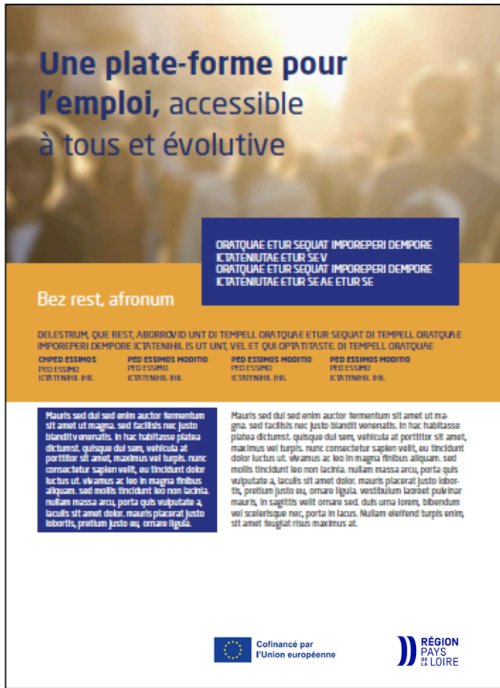
Exemple de brochure