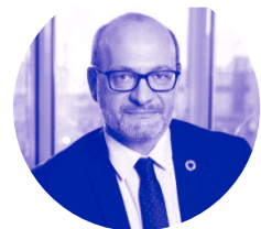
Rémy Rioux, directeur général du groupe Agence française de développement

Je suis fière de l'action menée par la Région des Pays de la Loire et l'Agence française de développement (AFD) auprès des collectivités locales libanaises grâce au projet SOCLE. Fort de sa capacité à fédérer, SOCLE a permis l'émergence de 12 projets environnementaux malgré un contexte difficile au Liban. En gardant des objectifs clairs en matière de formation, de transition écologique et d'emploi, nous espérons aujourd'hui que ce projet pourra se révéler inspirant pour poursuivre l'action régionale à l'international.