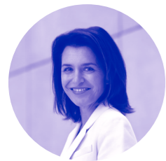
Christelle Morançais, présidente de la Région des Pays de la Loire

Je suis fière de l'action menée par la Région des Pays de la Loire et l'Agence française de développement (AFD) auprès des collectivités locales libanaises grâce au projet SOCLE. Fort de sa capacité à fédérer, SOCLE a permis l'émergence de 12 projets environnementaux malgré un contexte difficile au Liban. En gardant des objectifs clairs en matière de formation, de transition écologique et d'emploi, nous espérons aujourd'hui que ce projet pourra se révéler inspirant pour poursuivre l'action régionale à l'international.