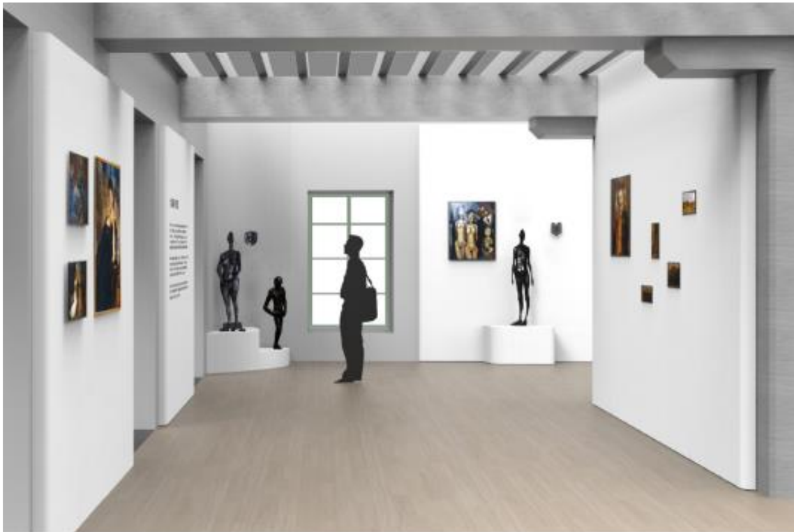
Vue de la salle d'introduction évoquant l'appartement du collectionneur avec les statues de Germaine Richier.