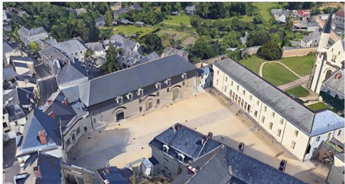
ZSDM ARCHITECTES CHRISTOPHE BATAARD ACMH - CONSTANCE GUISET STUDIO - BETOM - KHEPHREN

Les travaux débuteront dès l'automne et deux chantiers vont être conduits de manière concomitante : le musée (maîtrise d'ouvrage Région) et l'accessibilité de la cour d'honneur de l'Abbaye (maîtrise d'ouvrage État), tous deux sous l'unique maîtrise d'œuvre de l'architecte en chef des monuments historiques.