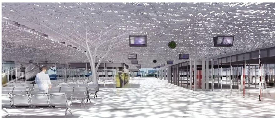
Intérieur de la mezzanine

LE PREMIER ARBRE PILIER, SYMBOLE ARCHITECTURAL DE LA NOUVELLE GARE, DEVOILÉ AU GRAND PUBLIC