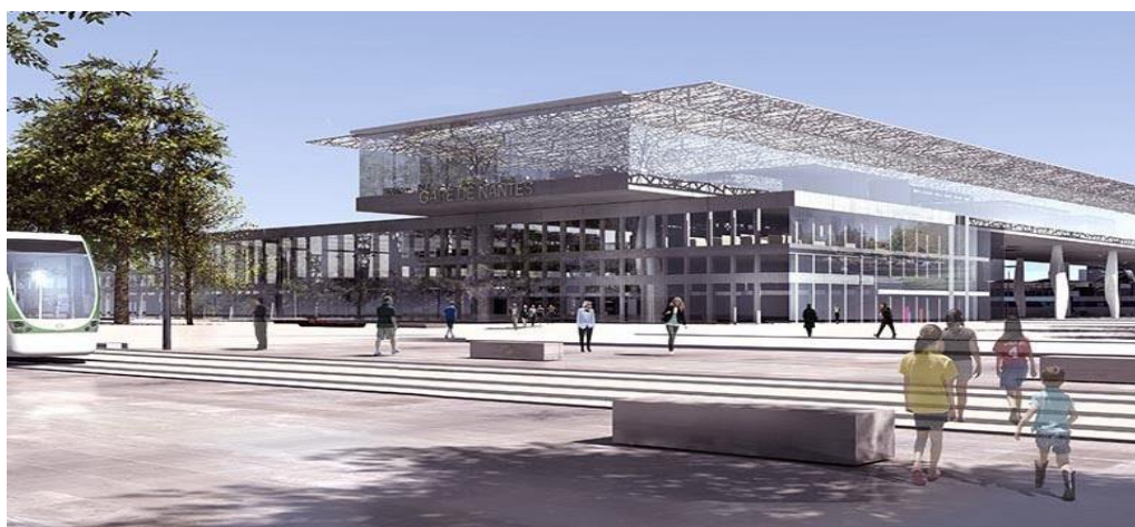
Vue de la gare Nord

Cette nouvelle gare de Nantes, ce n'est pas seulement le projet Cœur de gare.