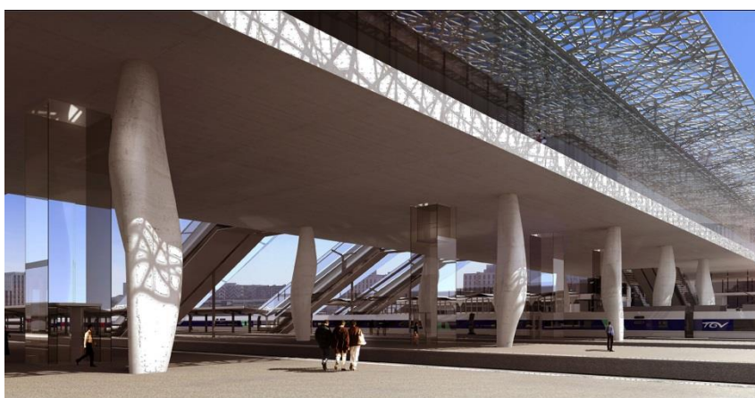
Vue depuis le quai A